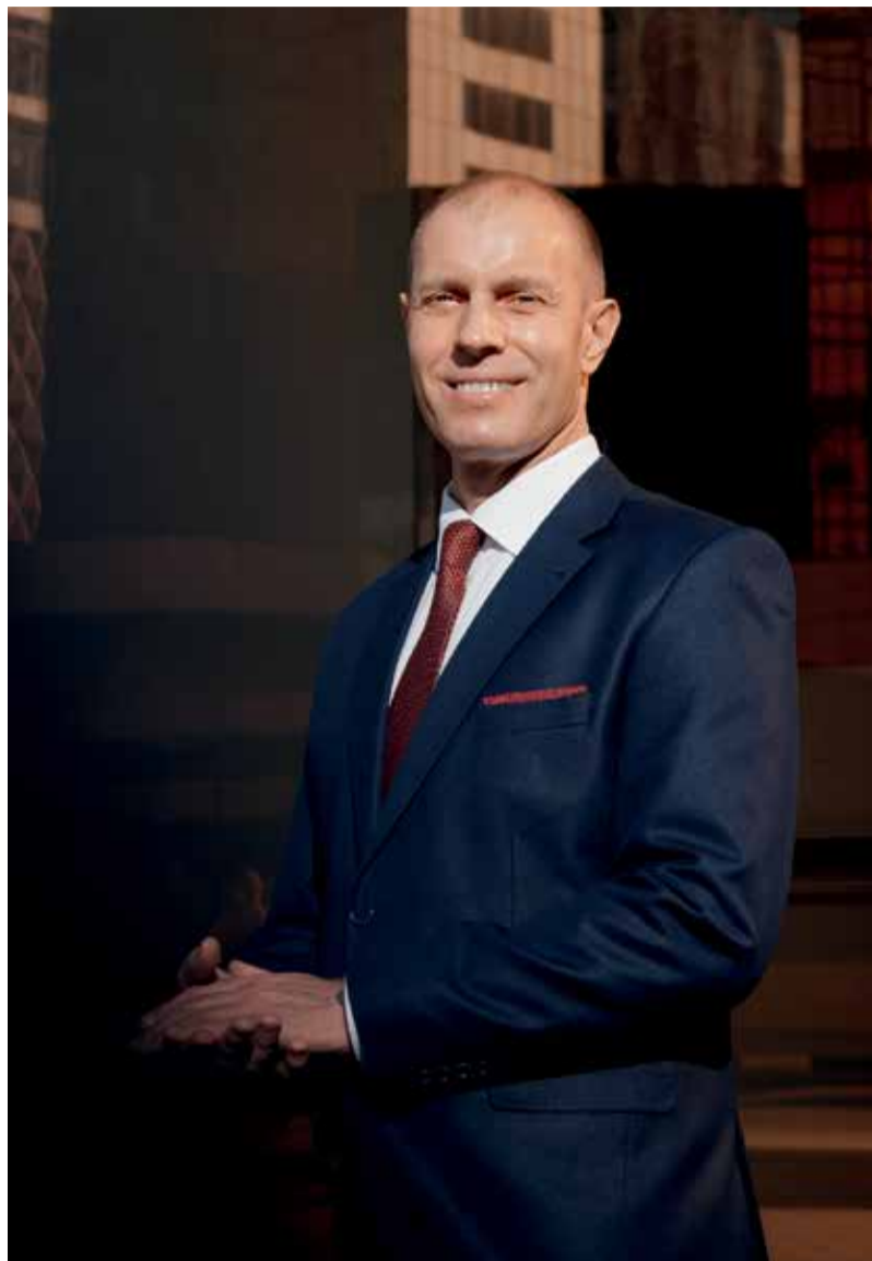
На наших инфоресурсах мы запускаем рубрику полезных материалов о медиации для бизнеса. Не пропустите!

Приставы и банк обязаны исполнить медиативное соглашение в том же порядке, как исполняется обычный исполнительный лист, выданный судом.