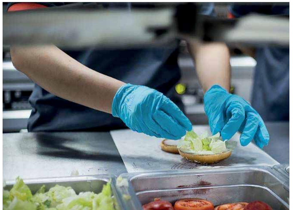
Объекты общественного питания - в зоне повышенного внимания налоговой службы. Всё, что вы должны знать о проекте - читайте в материале

— Исправить ошибку при работе на ККТ всегда возможно, для этого существует чек коррекции. Так, налогоплательщик, добровольно заявивший в налоговый орган в письменной форме о неприменении им ККТ в установленных случаях и до-