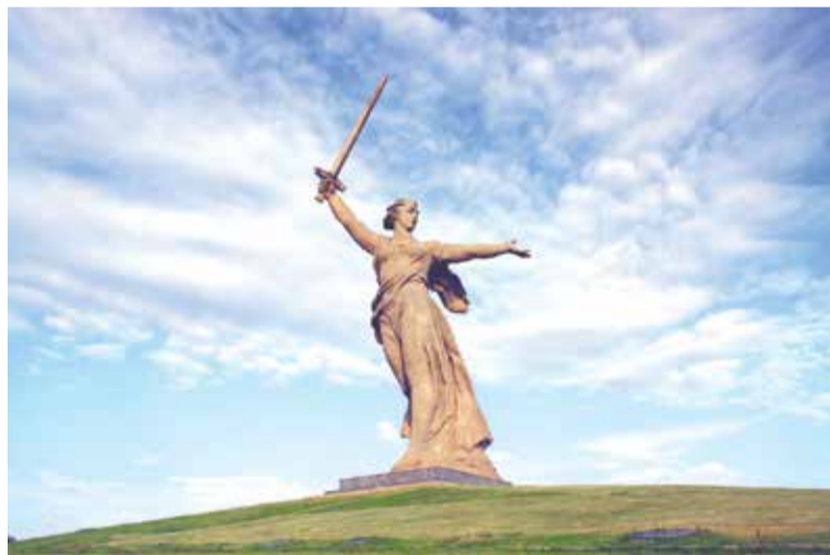
Символично название форума «Движение только вперед!». Эти строки выбиты на комплексе «Мамаев курган», который посетили с экскурсией участники форума.

В рамках второго дня также прошли стратегические сессии, посвященные работе «ОПОРЫ РОССИИ» в различных направлениях: развитие молодежного предпринимательства, строительство, ценностно-ориентированное предпринимательство, женское предпринимательство.