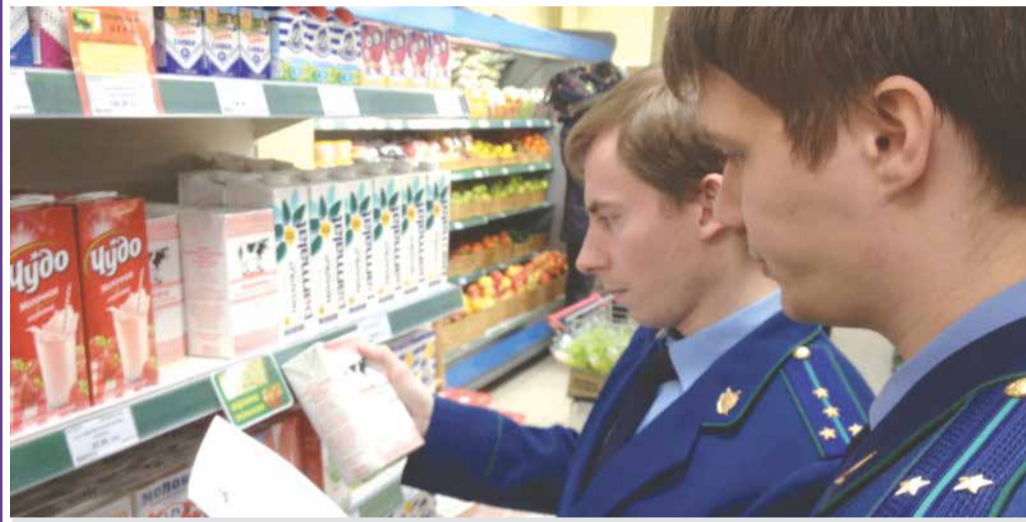
Контрольная закупка будет новым методом проверки бизнеса

«Для того чтобы посмотреть, качественная или некачественная продукция, нам нужно сегодня оформить распоряжение на проверку того или иного объекта или субъекта надзора, и проверять весь магазин. Новый же вид проверок (закупка — прим. ред.) — это надзор за конкретной продукцией в обороте, а не за всем магазином», — отметила Попова.