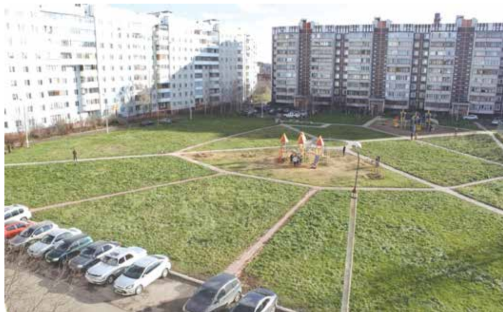
Передача военных городков на баланс муниципалитетов — болезненная тема для предпринимателей Солнечногорска