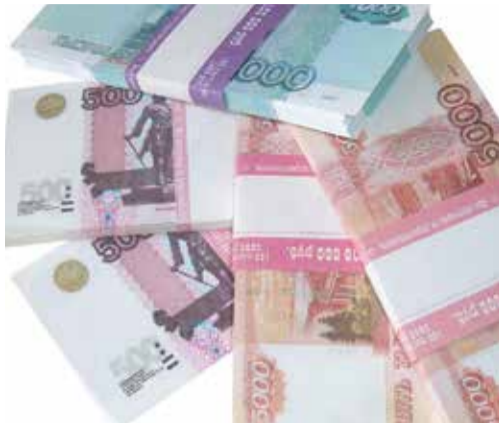
В Подмосковье стартовали конкурсы на получение субсидии. Успевайте подать заявку!

Уважаемые читатели! Присылайте свои вопросы на opora-mo@mail.ru , и ответы на самые интересные вы увидите в следующем номере газеты.