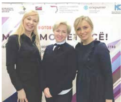
Организаторы фотовыставки - сами не только мамы, но и успешные предприниматели!

Стартовала она накануне женского праздника 8 марта в областном доме Правительства, и выставку в тот день увидели самые почетные