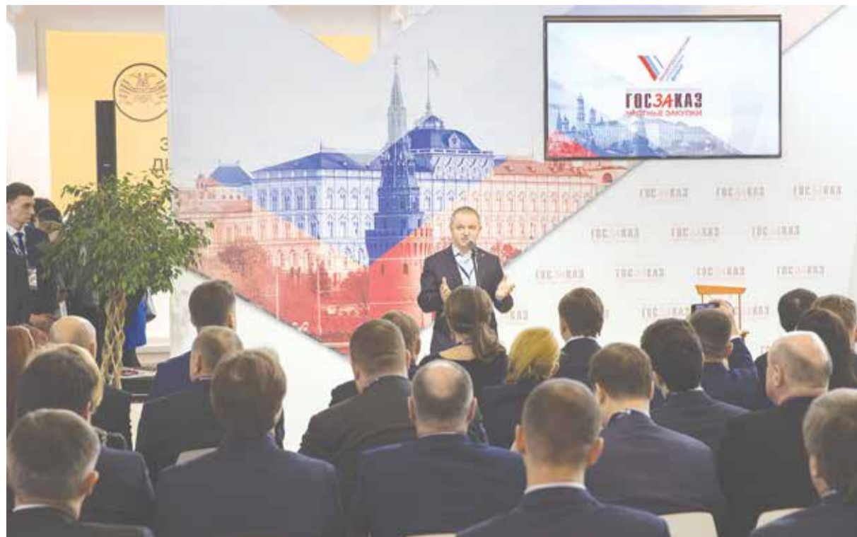
Форум «Госзаказ» - главная площадка страны для обсуждения темы закупок

носителей — заказчики и поставщики заключают договоры с помощью электронной цифровой подписи, а об обязательствах и сроках исполнения напоминает специальное мобильное приложение.