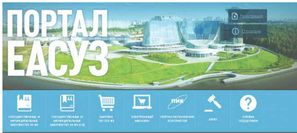
Пользователи отмечают удобство использования портала ЕАСУЗ

«Тенденция монополизации некоторых рынков продолжает тревожить «ОПОРУ РОССИИ». Наши исследования говорят о том, что, несмотря на принятый Указ Президента о развитии конкуренции, на самом деле есть противоположная тенденция по монополизации рынков сбыта. Причем часто эту монополизацию осуществляют ГУПы — то есть те, кто не должны заходить на конкурентные рынки. Мы надеемся, что цифровизация поможет сделать закупки более прозрачными».