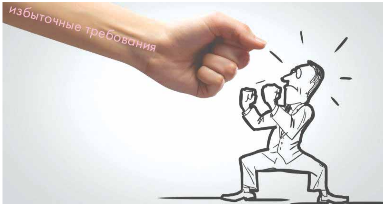
Неравный бой бизнеса с избыточными требованиями — суровая реальность, переломить которую пока не удастся!

Мы, как представители бизнеса, должны подходить к любой задаче с точки зрения ресурсов и задач, которые можно решить с их помощью. Так давайте реально оценим сложность и суммарную конечную трудоемкость той задачи, которую поставил Президент.