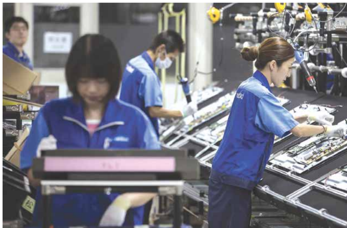
На долю Японии приходится производство около 12% мировых промышленных товаров. Японские товары давно стали символом качества, надёжности и высокотехнологичности

Вся деятельность предприятия, включая управленческие решения, должна быть подчинена постоянному избавлению от ненужного: действий, процессов, оборудования, излишних запасов, и повыше-