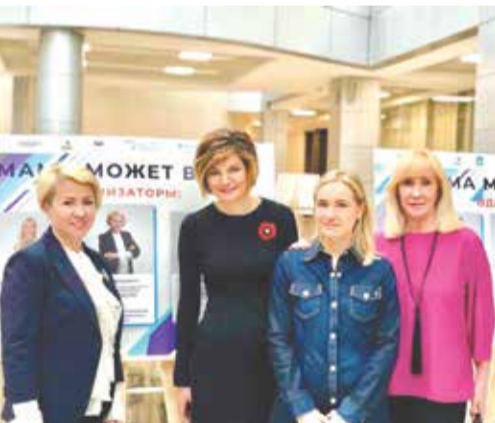
Проект получил поддержку депутата Госдумы Оксаны Пушкиной

К слову, когда началась глобальная подготовка к организации выставки, к работе подключились буквально все — представители областного Правительства и главы муниципалитетов, коллеги из общественных объединений и Общественной палаты, журналисты, блоггеры, и даже известный общественный деятель, депутат Госдумы Оксана Пушкина. Официальным партнером проекта выступила Управляющая компания «ОТКРЫТИЕ».