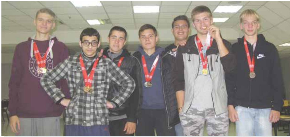
Команда «Дельфика» после награждения