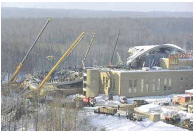
Если бы вовремя проводился мониторинг состояния сложных конструкций аквапарка, возможно, трагедии в Трансвааль-парке удалось бы избежать...

Председатель комитета по внутренним коммуни-