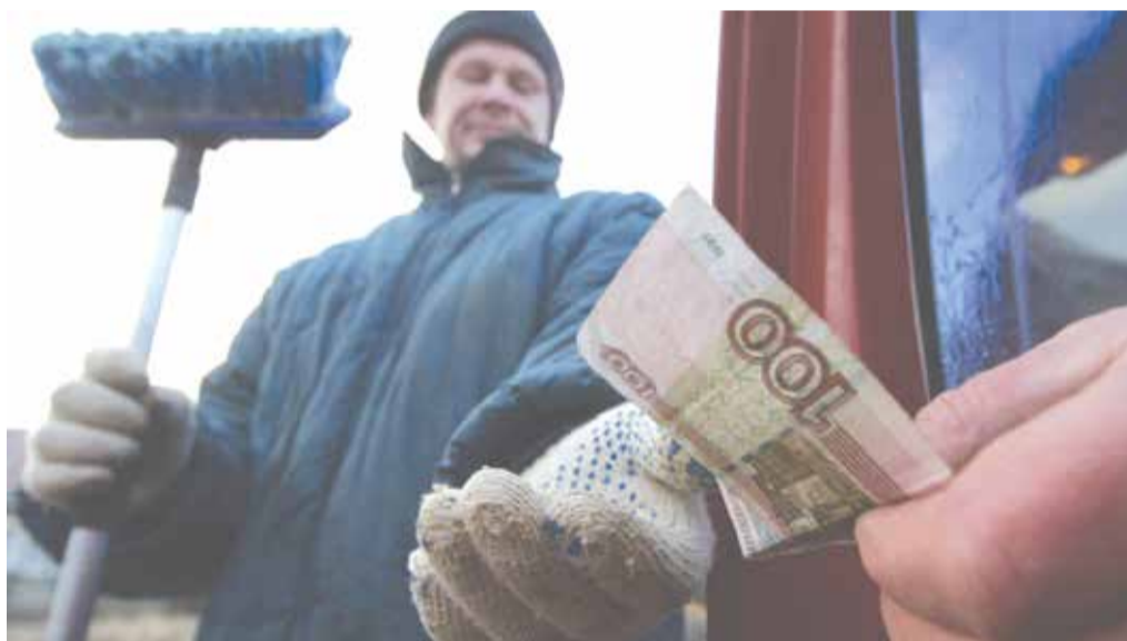
Предлагаемые меры, по расчётам авторов, устранят действующую несправедливость в отношении более 20 млн граждан, находящихся за чертой бедности.

По данным Евростата, несмотря на финансовый кризис, средняя почасовая оплата труда в ЕС с 2008 по 2012 г. выросла на 8,6%. Самый высокий уровень оплаты труда в 2013 г. был зафиксирован в Швеции (39 евро в час) и Дании (38,1 евро в час), самый низкий показатель из европейских стран — в Болгарии (3,7 евро) и Румынии (4,4 евро). В среднем же стоимость одного часа труда в странах ЕС составляет 23,1 евро, а в странах еврозоны — 27,6 евро. В США минимальная почасовая оплата труда поддерживается на уровне 7 долл. (в 13 штатах утвержден более высокий уровень — 8,5 долл.). Еще в 2013 г. среднестатистическая ставка почасовой