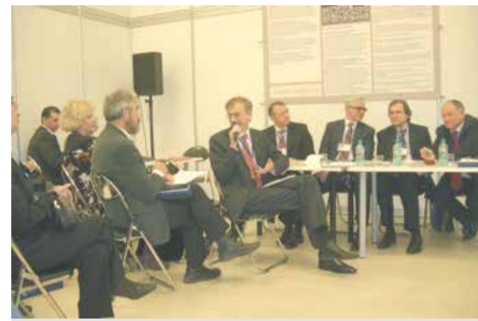
Гражданский форум 2008 год

Начало работы Правительственной комиссии по развитию малого и среднего предпринимательства.