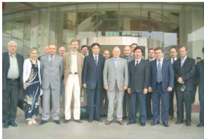
2004 Делегация Опоры в Китае

Делегация ОПОРЫ РОССИИ посетила Республику Сингапур. Заседание Совета по конкурентоспособности и пред-