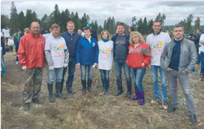
ОПОРА не осталась в стороне и от акции «Наш лес. Посади свое дерево». Она прошла за несколько дней до посадки сирени в городском парке