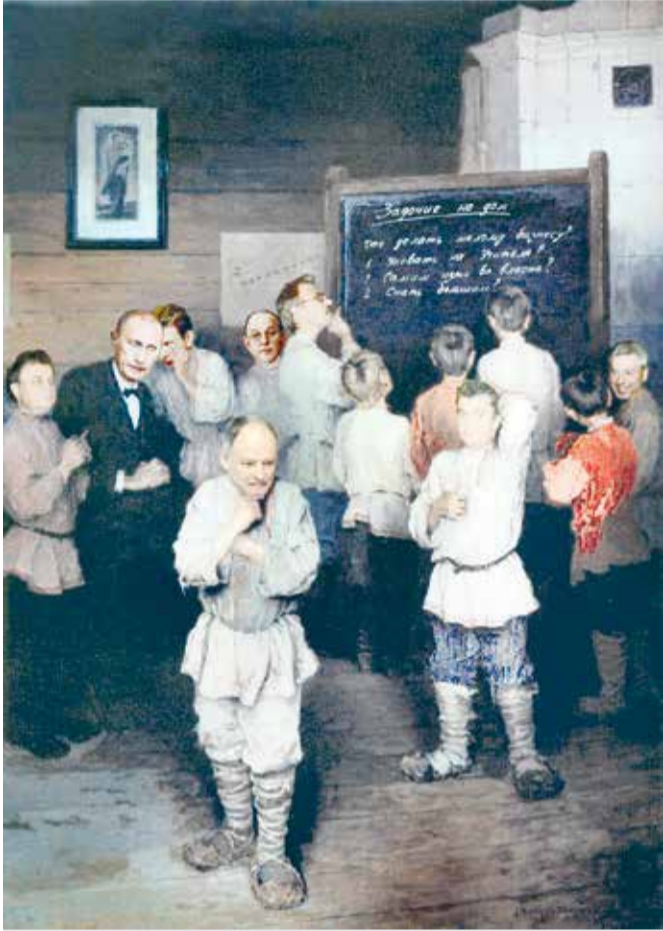
Устный счет. Шарж

Подписано Соглашение о взаимодействии институтов развития и заинтересованных организаций в сфере обеспечения непрерывного финансирования инновационных проектов на всех стадиях инновационного цикла (так называемый «инновационный лифт»).