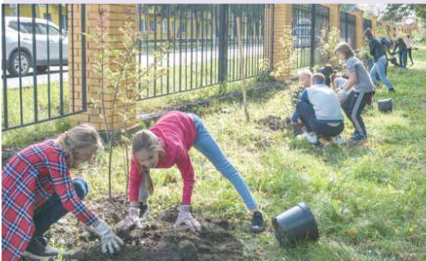
Школьников захватил увлекательный процесс посадки сирени!

Именно так подмосковную Истру с любовью зовут ее жители. И это не просто так: город утопает в зелени, среди которой особое место занимает душистая сирень. Акции по посадке этого любимого всеми кустарника проходит здесь с завидным постоянством.