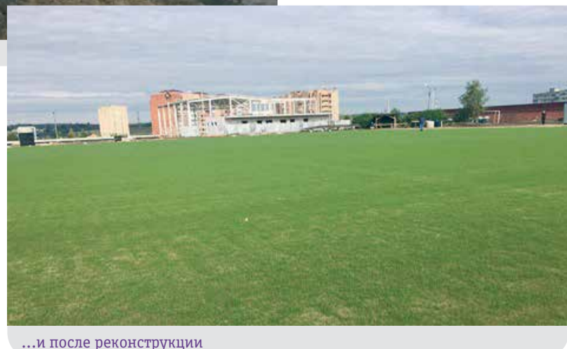
...и после реконструкции

— Объектов несколько: административно-бытовой комплекс, раздевалки и душевые, тренажеры и кафе, столовая, трибуны и, конечно же, само футбольное поле. К нему предъявляются особые требования! Например, покрытие у него обяза-