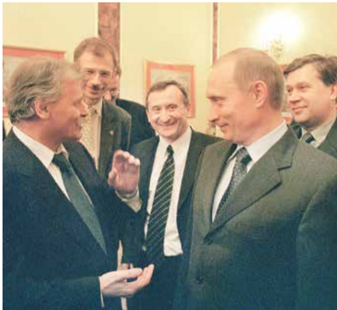
Встреча актива с Президентом

Встреча актива НП «ОПОРА» с Президентом России В. В. Путиным.