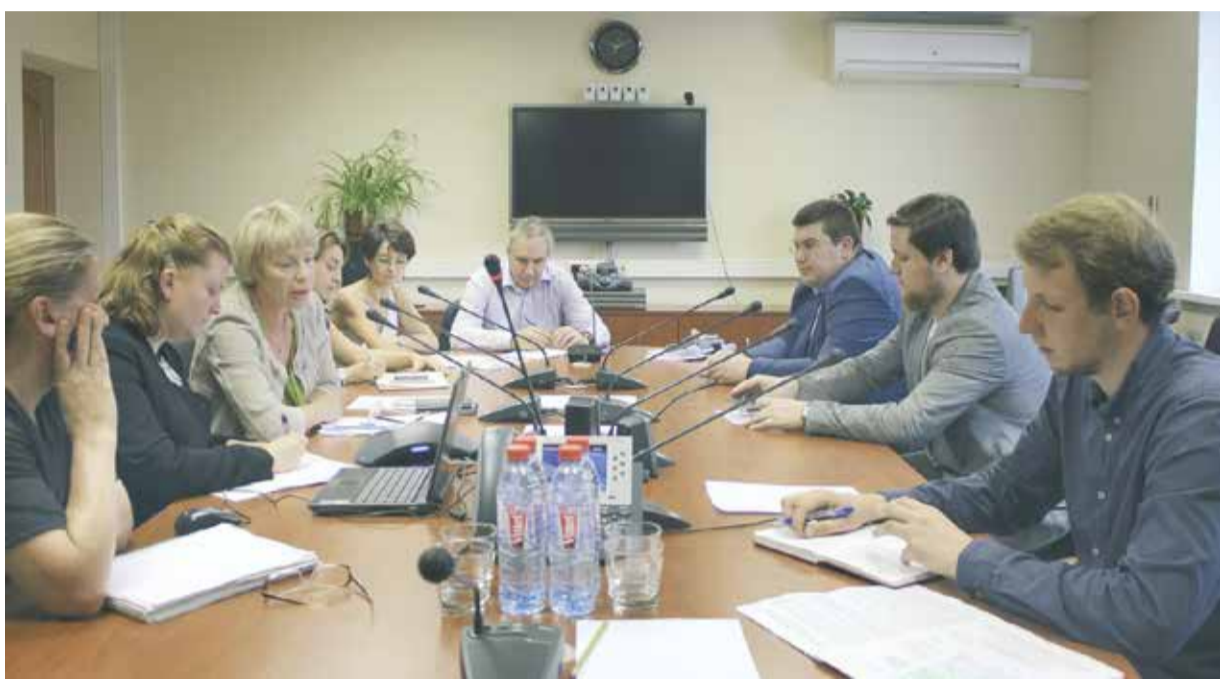
Вот так проходит «горячая линия» подмосковного Росреестра. Команда специалистов разбирает каждый вопрос

— Это выписка из Единого государственного реестра недвижимости о кадастровой стоимости объекта недвижимости, содержащая сведения об оспариваемых результатах определения кадастровой стоимости; нотариально заверенная копия правоустанавливающего или правоудостоверяющего документа на объект недвижимости в случае, если заявление о пересмотре кадастровой стоимости подается лицом, обладающим правом на объект недвижимости, либо оригинал выписки из Единого государственного реестра недвижимости об основных характеристиках и зарегистрированных правах на объект недвижимости; документы, подтверждающие недостоверность сведений об объекте недвижимости, использованных при определении его кадастровой стоимости, в случае, если заявление о пересмотре кадастровой стоимости подается на осно-