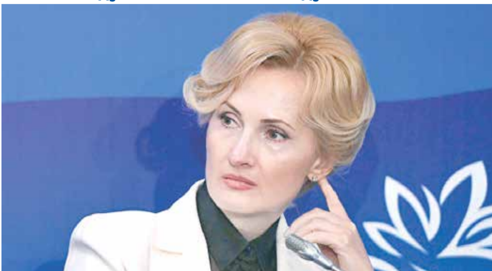
Имя Ирины Яровой в последнее время на слуху еще и из-за инициативы, которую бизнес поддержал. Группа парламентариев во главе Ириной Яровой внесли в Госдуму законопроект, запрещающий ритейлерам возвращать непроданный товар поставщикам

С 2018 года такое правило не применяется, вести раздельный учет придется в любом случае.