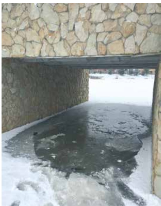
То самое злополучное место

За проявленную отвагу, смелость и спасение жизни представители областного МЧС торжественно наградили новоиспеченных спасателей почетной грамотой!