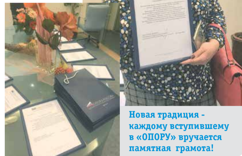
Новая традиция - каждому вступившему в «ОПОРУ» вручается памятная грамота!

Также стало известно, что в ближайшее время в Московском областном отделении появятся два новых комитета – по развитию туризма и по торговле.