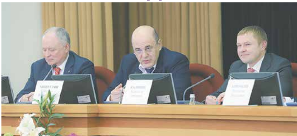
Михаил Мишустин: «Сегодня мы практически не проверяем малый бизнес. Охват проверками этой категории бизнеса - 1 проверка на 2 тыс. субъектов»

На совместном заседании Правления «ОПОРЫ РОССИИ» и НП «ОПОРА» обсудили с руководством Федеральной налоговой службы механизмы упрощения налогового администрирования