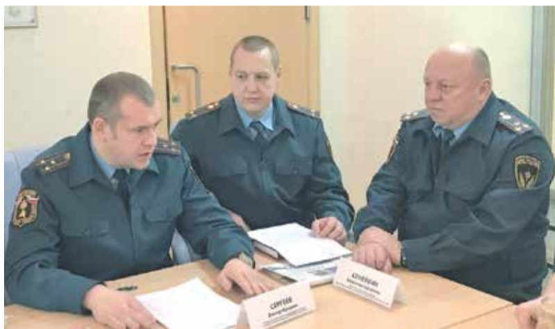
«ОПОРА РОССИИ» и МЧС давно работают в рамках подписанного Соглашения. Документ стал серьезным подспорьем для бизнеса

Всю информацию о вступлении в «ОПОРУ РОССИИ» вы найдете на нашем сайте www.oporamo.ru