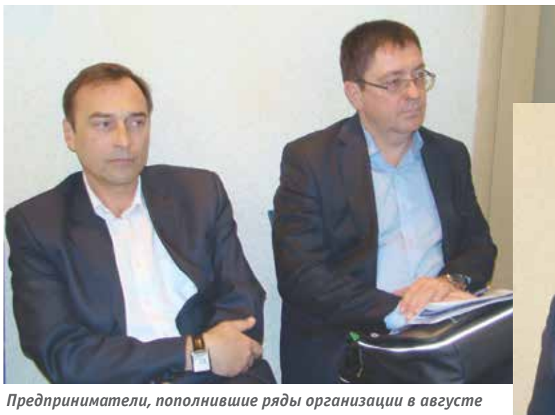
Предприниматели, пополнившие ряды организации в августе