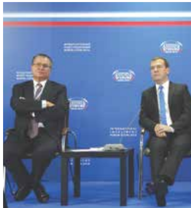
Панельная дискуссия «Защита прав предпринимателей. Диалог бизнеса и правительства»

По словам Корочкина, документально подтвержденные затраты только одной розничной сети на изготовление ветеринарно-сопроводительных документов составляют 600 000 000 рублей в год! И оцениваются по группе мясной продукции примерно в 5% от ее конечной розничной цены