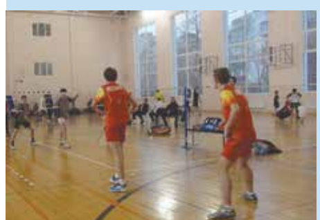
Турнир по бадминтону в г. Железнодорожный

— Вышел документальный фильм, рассказывающий о современных реалиях подмосковного бизнеса, социальных, экологических и культурных проблемах на примере города Железнодорожный. Его название — «Геноцид» — говорит само за себя. Создатели