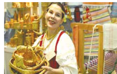
Малый бизнес нуждается в помощи! В этом году финансирование подпрограммы поддержки составит 1 млрд. 141 млн. рублей

Условия и порядок проведения Конкурса определены Порядком проведения конкурсного отбора по предоставлению субсидий субъектам малого и среднего