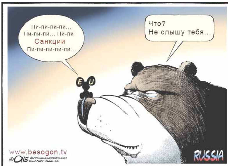
Такие карикатуры, связанные с санкциями, гуляют по Сети

Предприниматель из Долгопрудного, выразивший желание вступить в организацию — инвалид, сейчас он занимается IT-технологиями. Молодой человек предложил объединить предпринимателей-инвалидов под эгидой «ОПОРЫ РОССИИ».