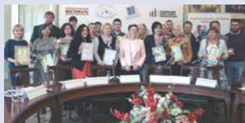
Среди награжденных журналистов — и главный редактор нашей газеты

Далее участники круглого стола рассказали об интересных проектах, связанных со взаимодействием бизнеса и СМИ. Тема выступления главного редактора