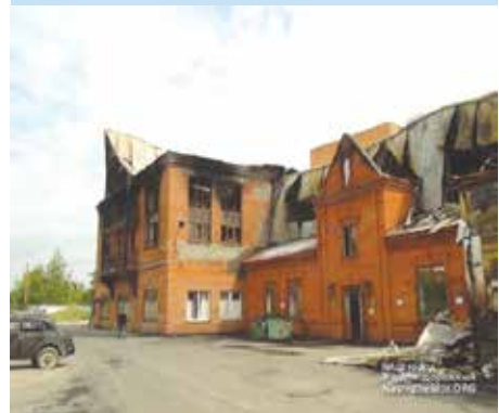
Страшный пожар не пощадил уникальный культурный центр

— Активно идет восстановление Центра православной культуры и спорта в городе Железнодорожный.