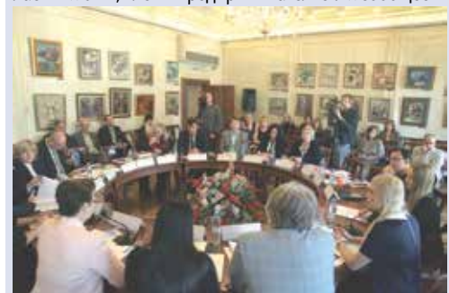
Прошедший круглый стол был приурочен к IV медиа-неделе Подмосковья

В его работе приняли участие представители областных СМИ, члены предпринимательских сообществ