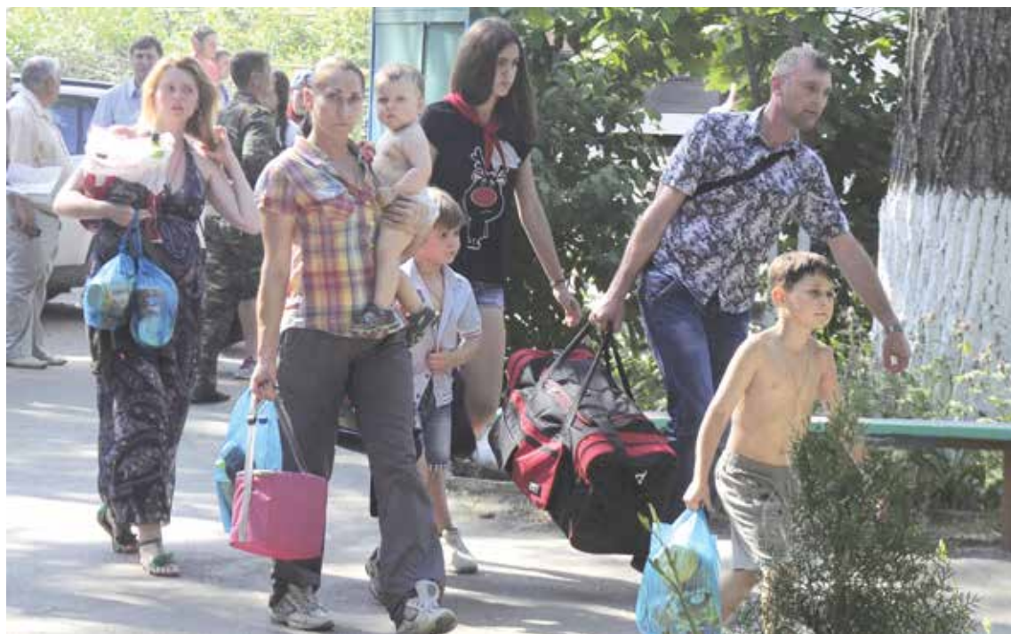
Тысячи беженцев едут в Россию. И почти всем нужна работа.

работодателю целесообразно проверять правомерность выдачи удостоверения беженца или свидетельства о предоставлении временного убежища на территории РФ в территориальных органах УФМС. В последнее время участились случаи предоставления поддельных документов.