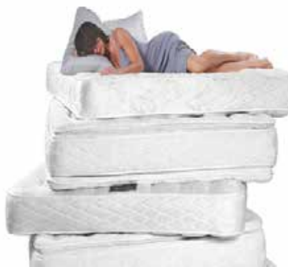
1/5 часть всех матрасов в стране производится в Шатурском районе

Производством товаров для сна в Шатуре занимается также структура мебельного холдинга ESTETICA — фа-