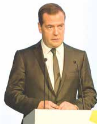
Дмитрий Медведев: «Наша общая задача — эффективно встроить муниципальные образования в общий процесс улучшения предпринимательского климата»