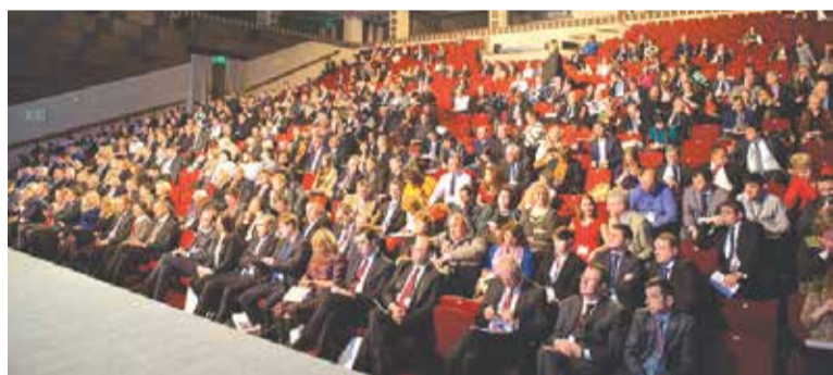
Участники форума сошлись во мнении: бизнесу нужен прорыв!

После сессии состоялось пленарное заседание с участием Председателя Правительства РФ Дмитрия