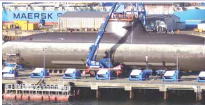
Подводная лодка класса U212 (Германия) с силовой установкой на водородных топливных элементах

В авторской статье Геннадия Багича, которую вы найдете на нашем сайте oporamo.ru в разделе «Материалы для скачивания», рассматриваются российские изобретения, с помощью которых создается возможность получения, например электроэнергии, за счет тепловой энергии окружающей среды.