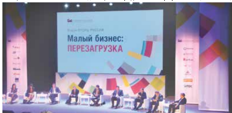
Поможет ли малому бизнесу перезагрузка, покажет время. Но то, что она нужна — не вызывает сомнений!

Завершая свое выступление, Дмитрий Медведев добавил: он надеется, что рекомендации, выработанные на форуме «ОПОРЫ РОССИИ», лягут на стол Правительства.