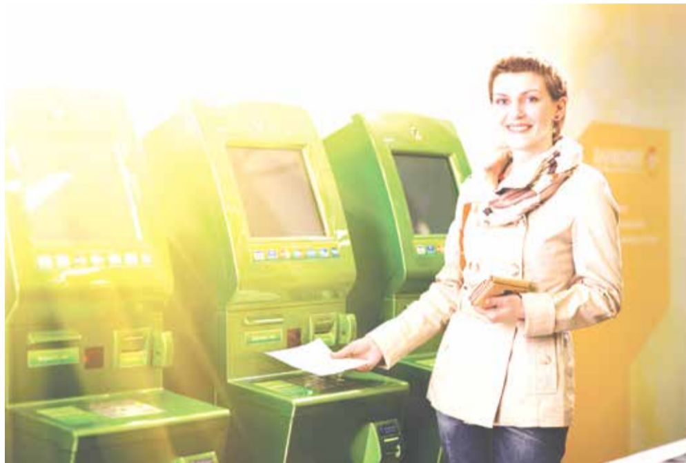
Услуга самоинкассации предназначена для розничных и мелкооптовых предприятий МСБ

Уважаемые читатели! Напоминаем, что вы можете присылать свои вопросы на тему взаимоотношений малого и среднего бизнеса с банковскими структурами. Ответы на свои вопросы ищите на страницах нашей газеты.