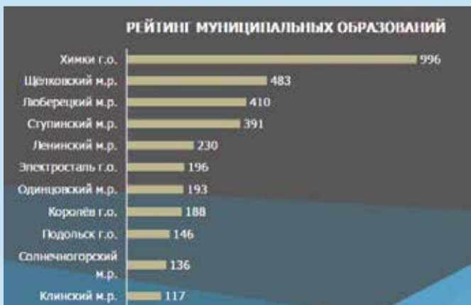
Лидеры по подаче заявок на премию (по состоянию на июль)

В этом году интерес к конкурсу заметно вырос и набрал обороты, премия