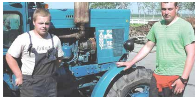
Областной колледж инновационных технологий в Щёлковском районе готовит разноплановых специалистов