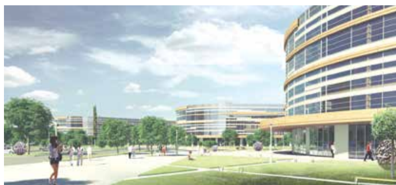
Иннополис — первый город в новейшей истории России, создаваемый буквально с нуля.

Программа включила в себя обсуждение вопросов развития предпринимательства, презентацию возможностей нового города, демонстрацию крупнейших инфраструктурных площадок для развития бизнеса в Татарстане, мастер-классы от ведущих российских экспертов.