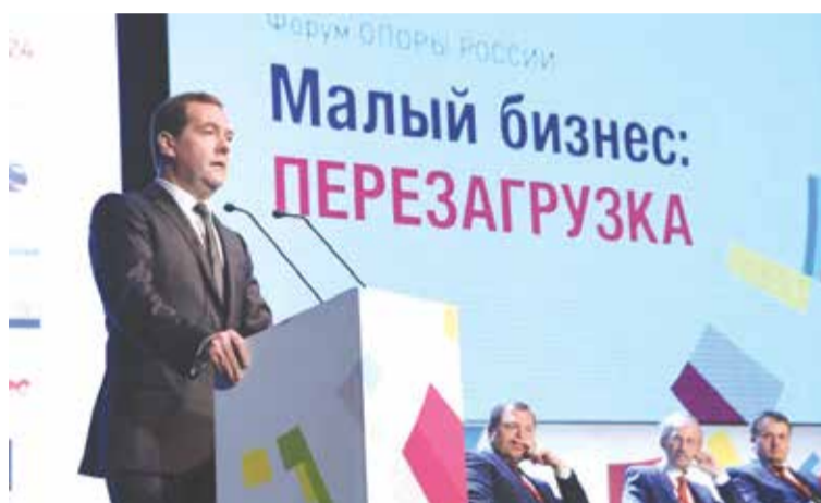
«ОПОРА РОССИИ» уже направила письмо Премьер-министру РФ Дмитрию Медведеву, где просит не увеличивать налоговую нагрузку на малый бизнес

Стало известно, что в Госдуме предложили не индексировать коэффициент-дефлятор ЕНВД на 2016 год и сохранить прежнюю ставку налога.