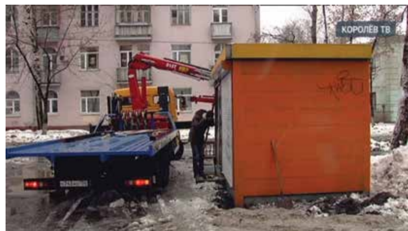
Демонтаж павильона на улице Болдырева в Королёве

приниматели города с нетерпением ждут публикации положения о конкурсе по предоставлению мест согласно новой схеме размещения нестационарных торговых объектов, чтобы принять в нём самое активное участие. Как правозащитник представителей бизнес-сообщества, я очень надеюсь, что для тех предпринимателей, которые много лет работали на своих местах, будет предусмотрена позиция о преимущественном размещении».