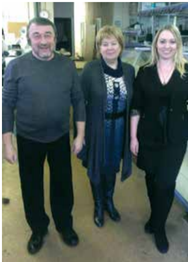
Руководители компаний, сотрудничающие в рамках комитета по внутренним коммуникациям областной «ОПОРЫ»

Своей успешной историей сотрудничества с нами поделились нынче действующие партнеры: ООО «КАТРИ» — производство и оптово-розничная продажа разнообразных изделий из трикотажа и ООО «Продвижение» — оказание услуг по полному циклу сопровождения юридических лиц для получения всех действующих мер финансовой государственной поддержки МСП по государст-