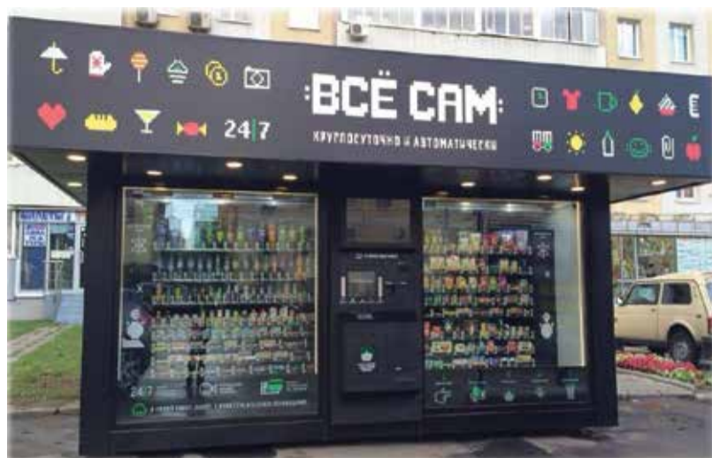
Креативные дизайнеры предлагают множество идей, как может выглядеть уличный ларёк. На фото — киоск «Всё сам», разработанный студией Артемия Лебедева

Напомним, первого марта прошлого года вступил в силу закон от 23.06.2014 №171-ФЗ «О внесении изменений в Земельный кодекс РФ и отдельные зако-