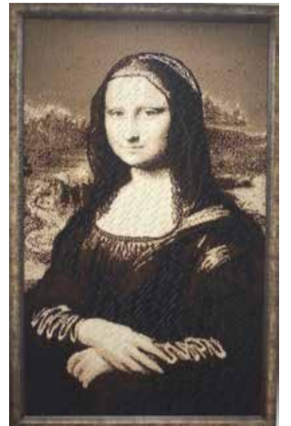
Вот такие шедевры выпускают на ткацкой фабрике

Об итогах реализации программы поддержки бизнеса в 2015 году — слайды ниже