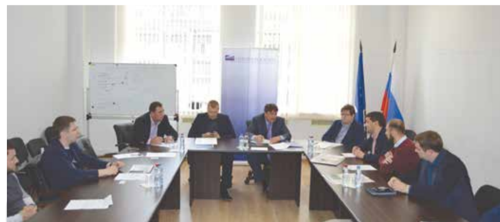
Комитет собрал строителей всех направлений