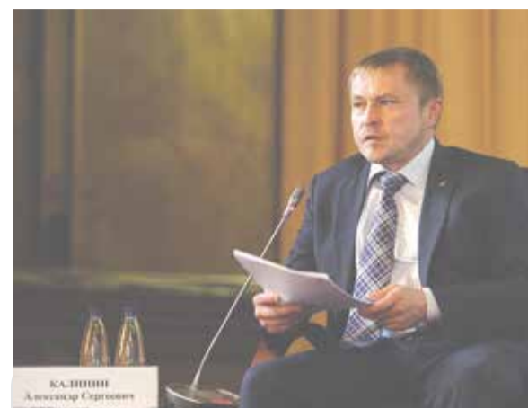
Президент «ОПОРЫ РОССИИ» Александр Калинин

«Сегодня ежегодно наши производители продовольственной группы несут порядка 700 млрд руб. в год издержек, связанных с избыточными требованиями. Вторая цифра