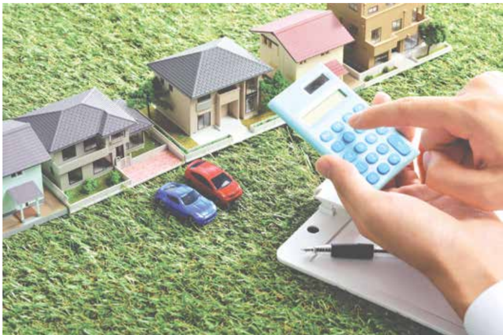
Регионы теперь вправе сами определить, когда вводить новую систему

Уважаемые читатели! Присылайте свои вопросы на opora-mo@mail.ru , и ответы на самые интересные вы увидите в следующем номере газеты.