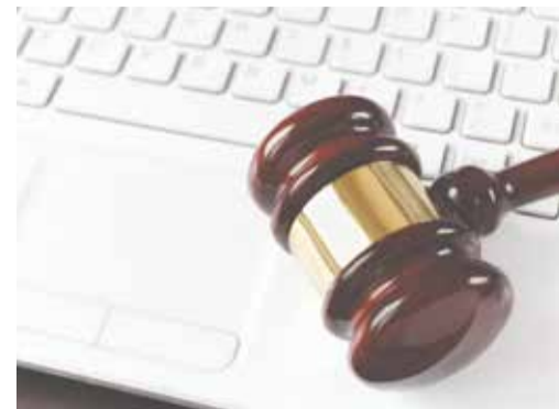
Закон направлен на предотвращение нарушений законодательства о контрактной системе в сфере закупок на стадиях планирования и исполнения контракта

Штраф от 20 до 50 тысяч рублей предусмотрен в случае приема товара (работы, услуги), не соответствующих условиям контракта, либо если это выявленное несоответствие поставщиком не устранено и привело к дополнительному расходованию бюджетных средств, либо уменьшению количества поставляемых товаров.