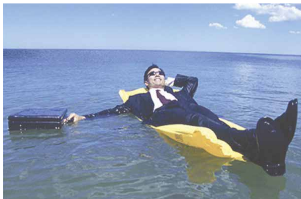
Прислушаются ли к инициативе бизнес-омбудсмена о «надзорных каникулах» и для среднего бизнеса, покажет время

Сейчас массовую кадастровую оценку проводят частные организации или индивидуальные оценщики, которых регионы и города выбирают на конкурсе.